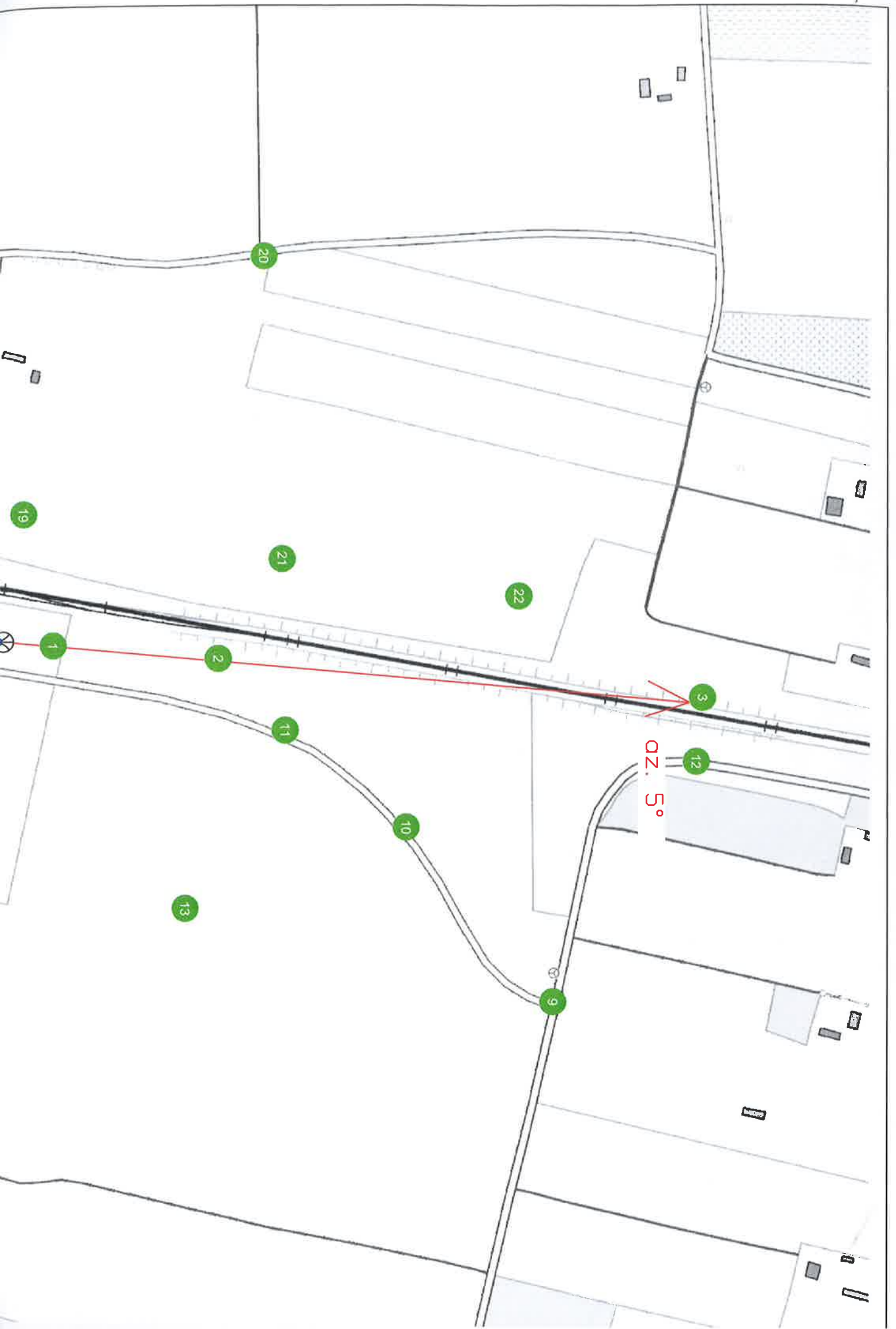
● Rys. 1 Lokalizacja pionów pomiarowych